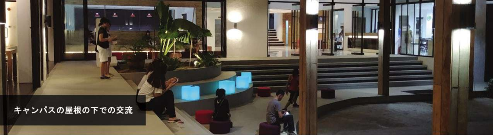
キャンパスの屋根の下での交流