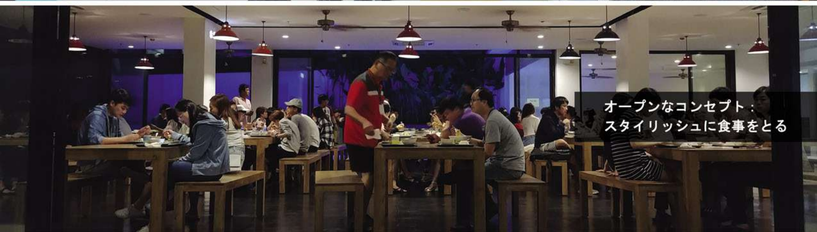
オープンなコンセプト： スタイリッシュに食事をとる