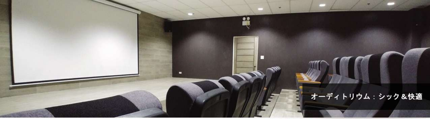
オーディトリウム：シック＆快適