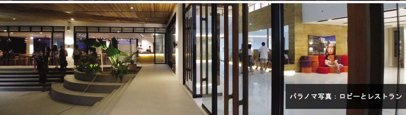
パノラマ写真：ロビーとレストラン