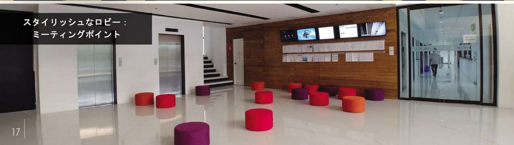
スタイリッシュなロビー： ミーティングポイント