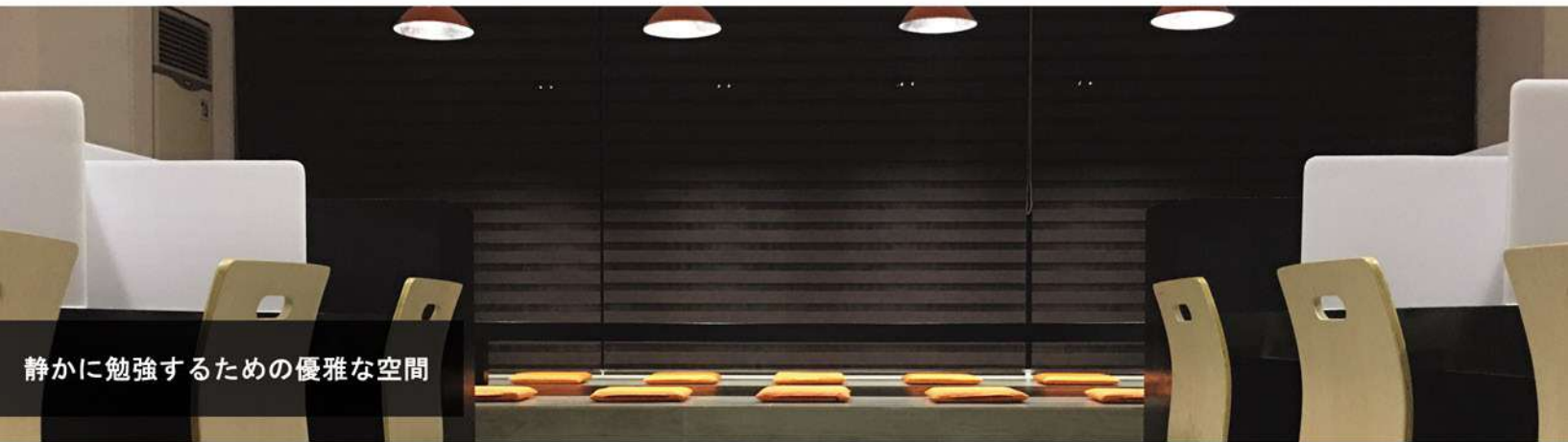
静かに勉強するための優雅な空間