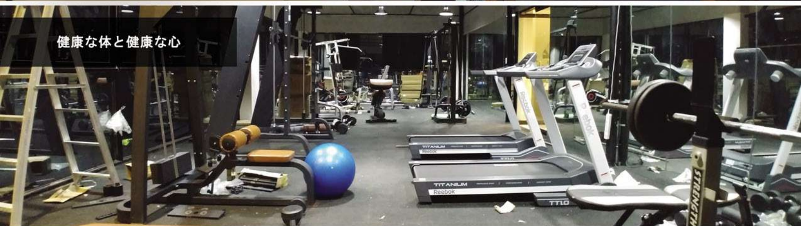
健康な体と健康な心

キャンパス内でより快適にお過ごしいただくために、さらにいくつかのショットを考えてみましょう。