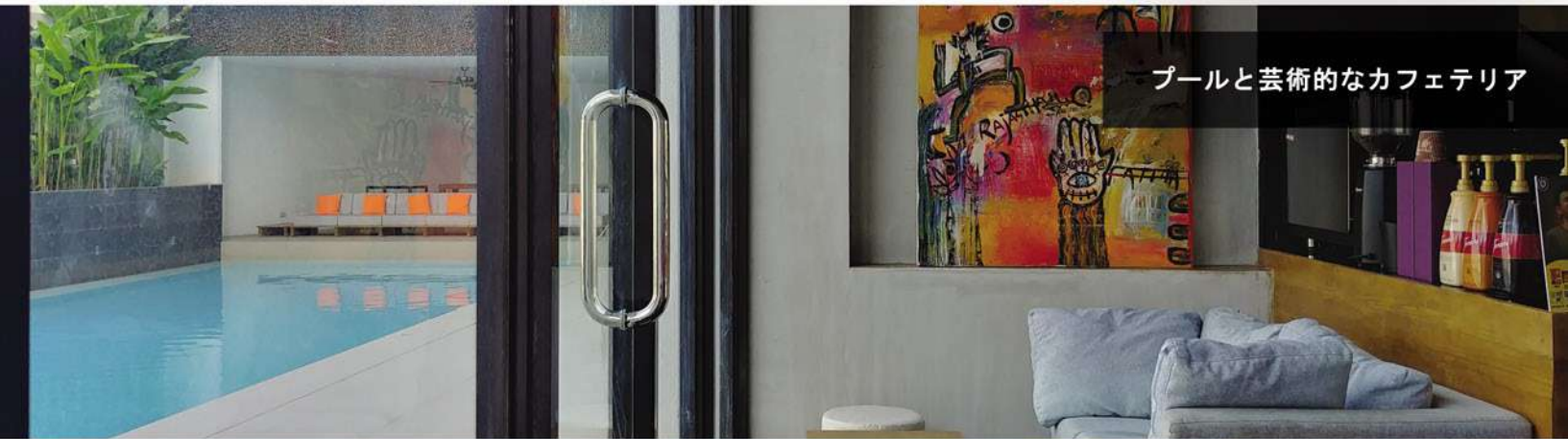
プールと芸術的なカフェテリア